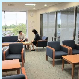
休憩可能なフリースペース