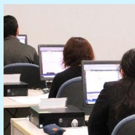
PCデスクは1人1台用意