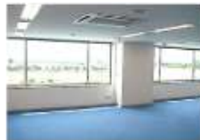
快適な オフィス空間