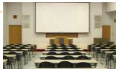
講演会、研修 会等に便利！